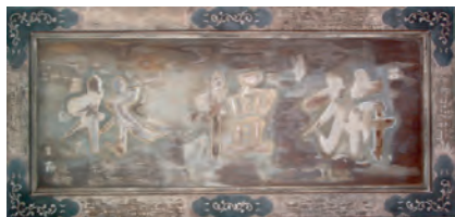
「旃檀林」扁額：吉祥寺（東京都文京区）山門（複製）

仏教の教義並びに曹洞宗立宗の精神を建学の理念とする駒澤大学を象徴する、国内外に例のないユニークで新しい博物館として、広く社会の文化の進展に寄与できるものと自負しています。