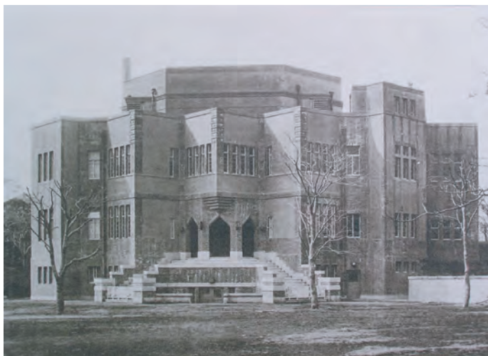
昭和 3(1928) 年当時の外観

禅語「耕雲種月」（雲を耕し、月に種を植えるように、 労苦をいとわず、着実に努力するさま）から「耕雲館」 と命名された駒澤大学旧図書館は、平成 11（1999）年に 東京都の歴史的建造物に選定されました。