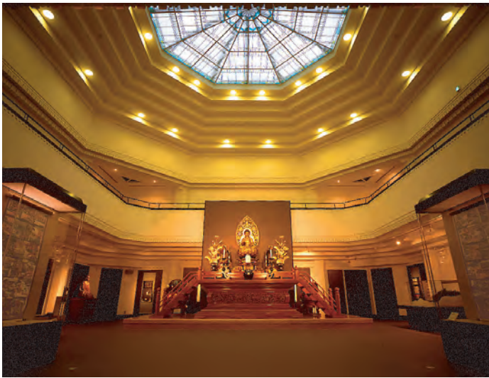
須彌壇と一仏両祖の尊像

駒澤大学禅文化歴史博物館は、東京都選定歴史的建造物に選定された「耕雲館」を保存・活用し、開校 120 周年記念事業の一環として平成 14 (2002) 年に開設されました。