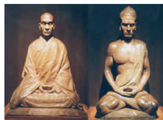
金保正智 作「澤木興道師坐禅像」「蟠龍」