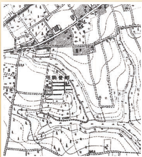
図1. 大日本帝國陸地測量部1910（明治43）年発行1万分の1地形図「碑文谷」の一部。中央部の横書きで右から「郷養鶏場」の記載があるとところが現在の駒澤大学。

現在、大学周辺は駒沢公園を除き建物で埋め尽くされている（図3）。東京都区部の他の住宅地同様、この地域でも再開発等による建物の大型化・高層化、低層住宅地域の建物の老朽化、人口構成の高齢化が急ピッチで進んでいる。