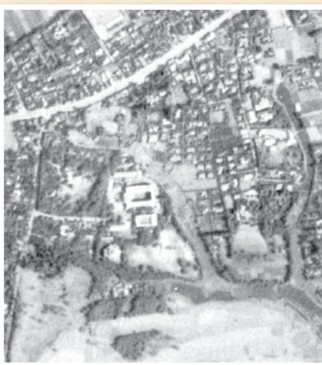
図2. 1936（昭和11）年旧陸軍撮影空中写真（B1-24）の一部。現在の駒沢公園の場所にあったゴルフコースや、現在も残る耕雲館の屋根が見える。呑川の支谷沿いには、この頃はまだ建物はない。