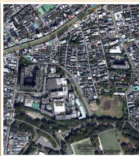
図3. Google Mapによる地図と衛星画像の合成地図（2013（平成25）年取得）。国土地理院による大縮尺の紙地図の更新は中止され、地図は電子データで配布、コンピュータで見えるものとなった。

今年は、本学が駒沢の地に移転して100年です。『駒沢移転100年特集②』は、次号309号（10月15日発行）に掲載いたします。また、11月2日（土）・3日（日）に開催する「オータムフェスティバル」で記念イベントを同時開催します。参加募集のお知らせは本誌の14ページをご覧ください。